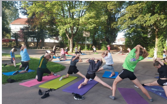
Übungsleiterlehrgang 2022 in Memmingen