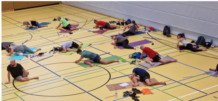
Schwaben- Summit 2023 in Bischofsgrün