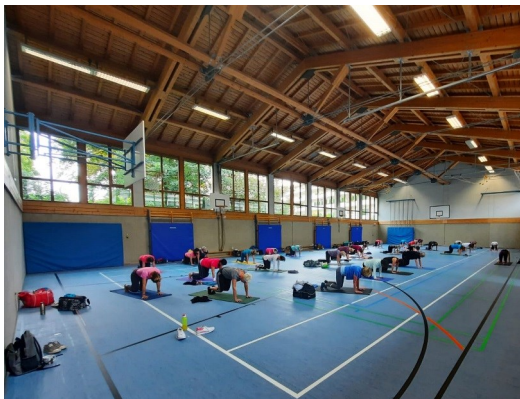
Fortbildungslehrgang der BSJ