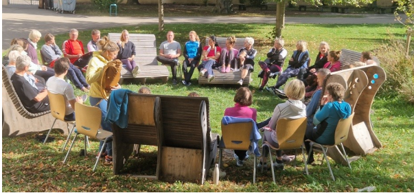
Lizenzverlängerung in Memmingen bei schönem Wetter auch mal im Freien