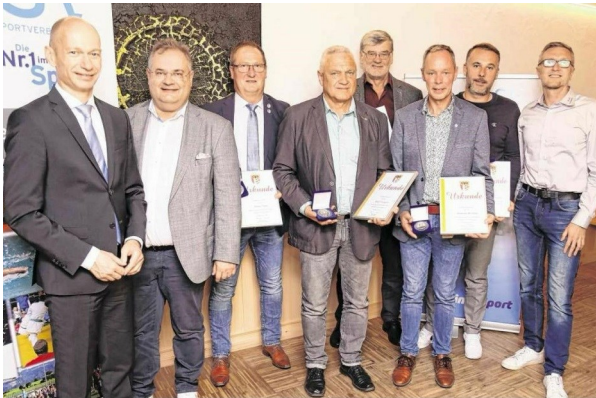
Bezirksehrenamtstag 2023 in Scheidegg