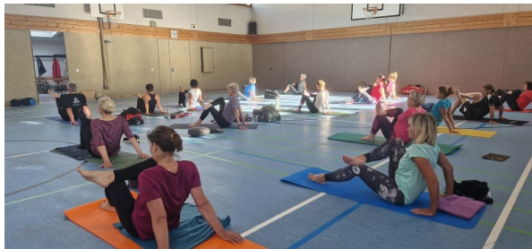
Lizenzverlängerung in Memmingen