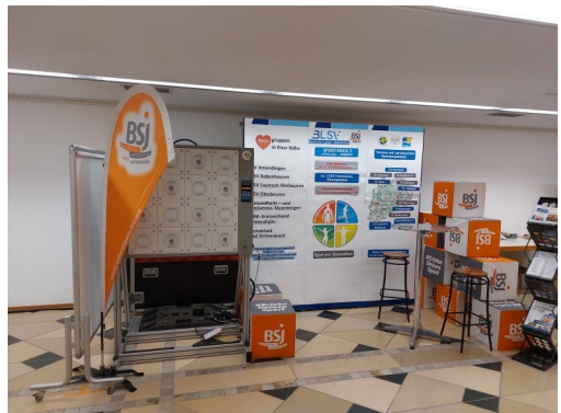
Messestand bei den Gesundheitstagen 2023 in Memmingen